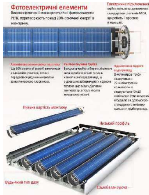
Рисунок 1 – Когенераційна фотоелектрична система Virtu PVT компанії Naked Energy.

Поглинаюча пластина - це екструдована тепла пластина з мідними каналами для сприяння турбулентному теплообміну. Вона мінімізує теплові втрати, оскільки використовує надлишкове тепло, що генерується фотоелектричними елементами, і генерує тепло до 80 °С. Це тепло може передаватися в будівлі через 8-ми міліметрові труби, під'єднані до 22-х міліметрового колектору. Виробник заявляє, що інтегровані рефлектори дозволяють системі збирати на 40% більше енергії порівняно зі звичайними фотоелектричними елементами, а колектори, що обертаються, можуть оптимізувати продуктивність на скатних дахах, плоских дахах і вертикальних фасадах. Одинарний трубчастий блок має розміри 2165 мм×300 мм×265 мм і важить 19,9 кг. Площа отвору становить 0,64 м 2 , а площа абсорбера - 0,324 м 2 . Пікова теплова потужність складає 275 Вт, а електрична - 70 Вт.