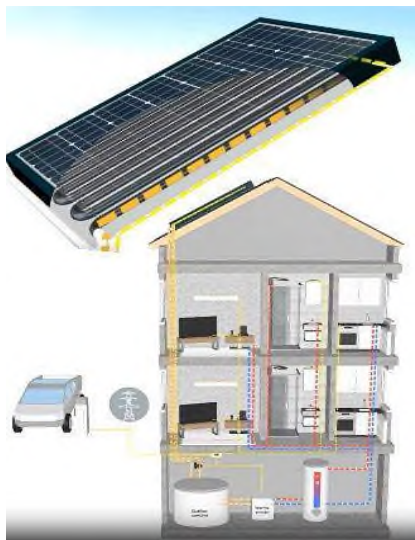
Рисунок 3 – Когенераційний сонячний модуль Sunmaxx PVT (Німеччина)

восени, тепло, вироблене КФЕП, спрямовується до шару ґрунтових вод, зберігається і використовується для обігріву теплиці взимку.