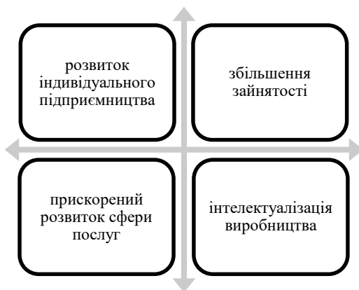
Рис. 1 Прямі позитивні соціальні ефекти інноваційного розвитку України

Розвиток індивідуального підприємництва в технологічній сфері свідчить про зміцнення інституту малого бізнесу, що є однією з ознак стійкості економіки та фактору зменшення диференціації населення. Збільшення зайнятості є проявом позитивного ефекту для ринку праці та джерелом зростання трудових доходів частини населення. Прискорений розвиток сфери послуг є важливою характеристикою постіндустріального суспільства, орієнтованого на розвиток людського потенціалу, підвищення якості життя та всебічний розвиток особистості. Інтелектуалізація виробництва підвищує вимоги для сфери освіти та підготовки кадрів, розкриває більше можливостей для реалізації творчого потенціалу. Отже, кожен з цих ефектів має позитивний вплив на соціальну сферу.