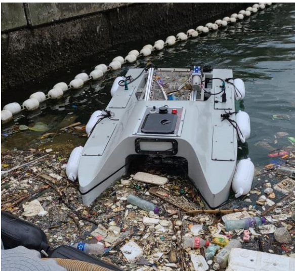
Рис. 2. Clearbot Neo – збирач океанічного сміття [12]

Clearbot (Китай) – це автономні роботи-збирачі океанічного сміття на основі ШІ (рис.2), які можуть виявляти та збирати сміття з води. Clearbot Neo здатен зібрати до 15 л нафти та 200 кг плаваючого сміття за день при мінімальних витратах енергоносіїв. Clearbot Neo – сучасний, ефективний і екологічно чистий спосіб очищення водних шляхів [12].