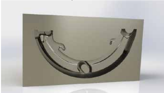
Рис. 3. Ливарна форма

вибрав зображення в форматі JPEG. Перед тим як запускати фінальний рендер можна перевірити зображення за допомогою Preview Window, та Integrated Preview. Вони виконують рендер неповної роздільної здатності, і він є дуже швидким, і підходить для швидкої оцінки зображення та його налаштувань.