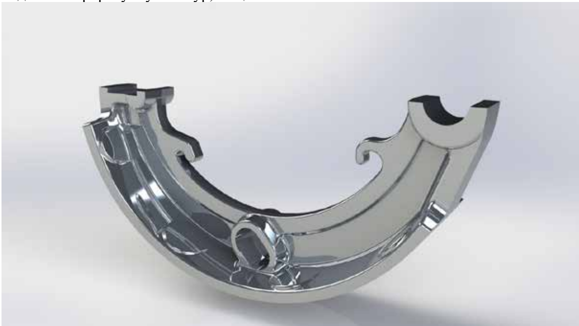
Рис. 4. Колодка гальмівна

Недоліком може бути лише та особливість програмного продукту, що рендер зображень відбувається за допомогою процесора, і не використовує ресурси відеокарти для пришвидшення прорахунку текстур, тощо.