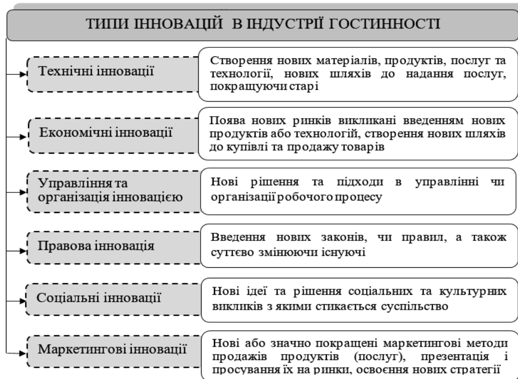
Рис. 2. Типи інновацій в індустрії гостинності [2]

Впевнені, що інноваційний розвиток сфери гостинності не тільки допомагає підприємствам пристосовуватися до сучасних вимог, але і робить їх більш конкурентоспроможними, стійкими та привабливими для клієнтів.