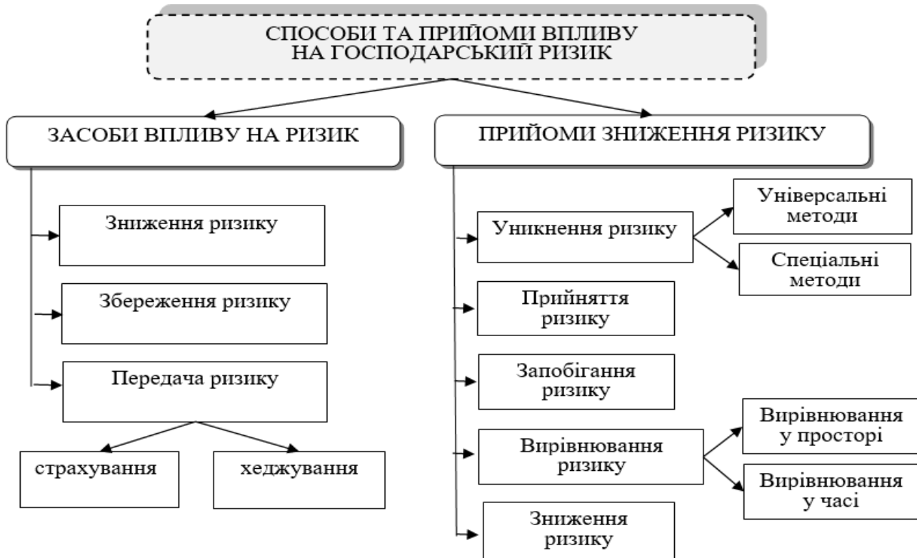
Рис. 3. Основні способи та прийоми впливу на господарський ризик

впливу на ризики є: зниження ризику, збереження, передача, уникнення, прийняття, запобігання та вирівнювання (рис. 3).