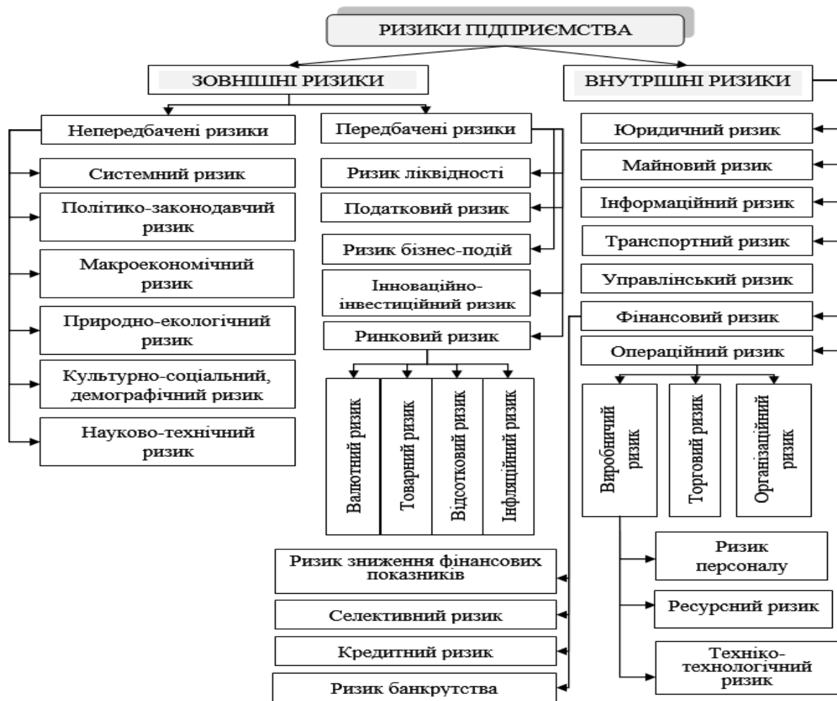
Рис. 1. Класифікація ризиків підприємства

Ризик може впливати як на окрему роботу, що здійснюється на підприємстві, так і на проєкт, що реалізується, а також на його діяльність загалом. Задля нейтралізації негативного аспекту ризику (як мінімум) та максимізації можливостей (як максимум) необхідним є налагодження й відпрацювання процесу управління ризиками. Управління ризиками є вимогою часу, що викликана змінами внутрішнього та зовнішнього середовищ діяльності підприємств [2].