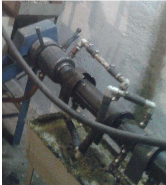
Рис. 2. Фрагмент робочих органів, до складу якого увійшли розроблені камера дожиму та орган остаточного формування брикету з системою контролю температури та відбору технічних олій

Для підвищення точності, всі заміри робилися на завчасно прогрітому пресі та повторювалися по 5 разів та бралось середнє значення величин. Час для всіх замірів складав 30 хв. Готова продукція збиралася в окремі ємкості а потім проходила зважування на електронних вагах. Для дослідів в якості сировини використовували відходи провіювання соняшника. Під час дослідів було задіяно сім секцій пристрою остаточного формування, з яких три секції були обладнані системою охолодження [16-18]. Вся система охолодження побудована таким чином, що частини пресу, які піддаються найбільшому нагріву, тобто камера дожиму та перші три секції пристрою остаточного формування, завдяки системі охолодження, мають однакову регульовану температуру, так як мають послідовне з'єднання вхідних та вихідних патрубків. Вся система охолоджується за допомогою прокачки охолоджуючої рідини через радіатор з вентилятором. Довжина пристрою остаточного формування становила 1,67 м.