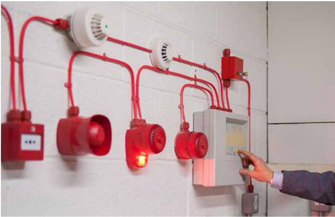
Рис. 1. Комплекс елементів протипожежної сигналізації

Висновки. Таким чином, структура системи пожежооповіщення налаштована отримання сигналів від спеціальних датчиків, виконуючими елементами яких чутливі елементи. Згодом отримані сигнали передаються до систем оповіщення персоналу та за допомогою програмного забезпечення до пункті реагування на надзвичайну ситуацію.