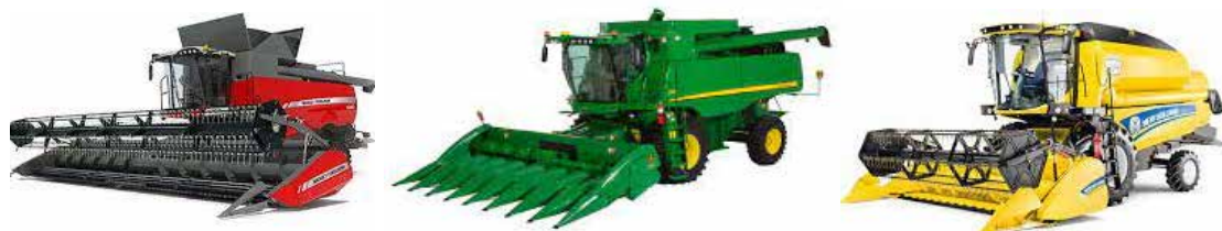
Рис. 1. Зернозбиральні комбайни

Основні матеріали дослідження. Урожай зернових культур найкраще збирати прямим комбайнуванням, особливо, якщо посіви однорідні та мають низьку забур'яненість. Важливо збирати їх, коли зерно повністю дозріло і має вологість 14-16%. Вибір методу збирання впливає на якість продукції і витрати. Зниження втрат зерна під час збирання, транспортування та зберігання є важливим аспектом. Пряме комбайнування - найоптимальніший метод для зернових. У разі нерівномірного дозрівання та великої забур'яненості може бути доцільним роздільне збирання. Щоб зменшити втрати зерна, слід розпочати збирати один день раніше, ніж досягне повної стиглості.