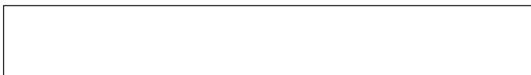
Рис. 1. Назва рисунку.