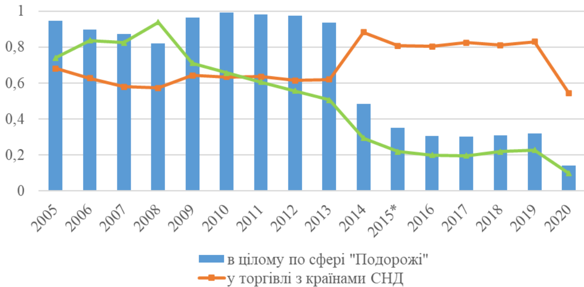
Рис. 1 Динаміка інтенсивності зовнішньої торгівлі України послугами у сфері подорожей