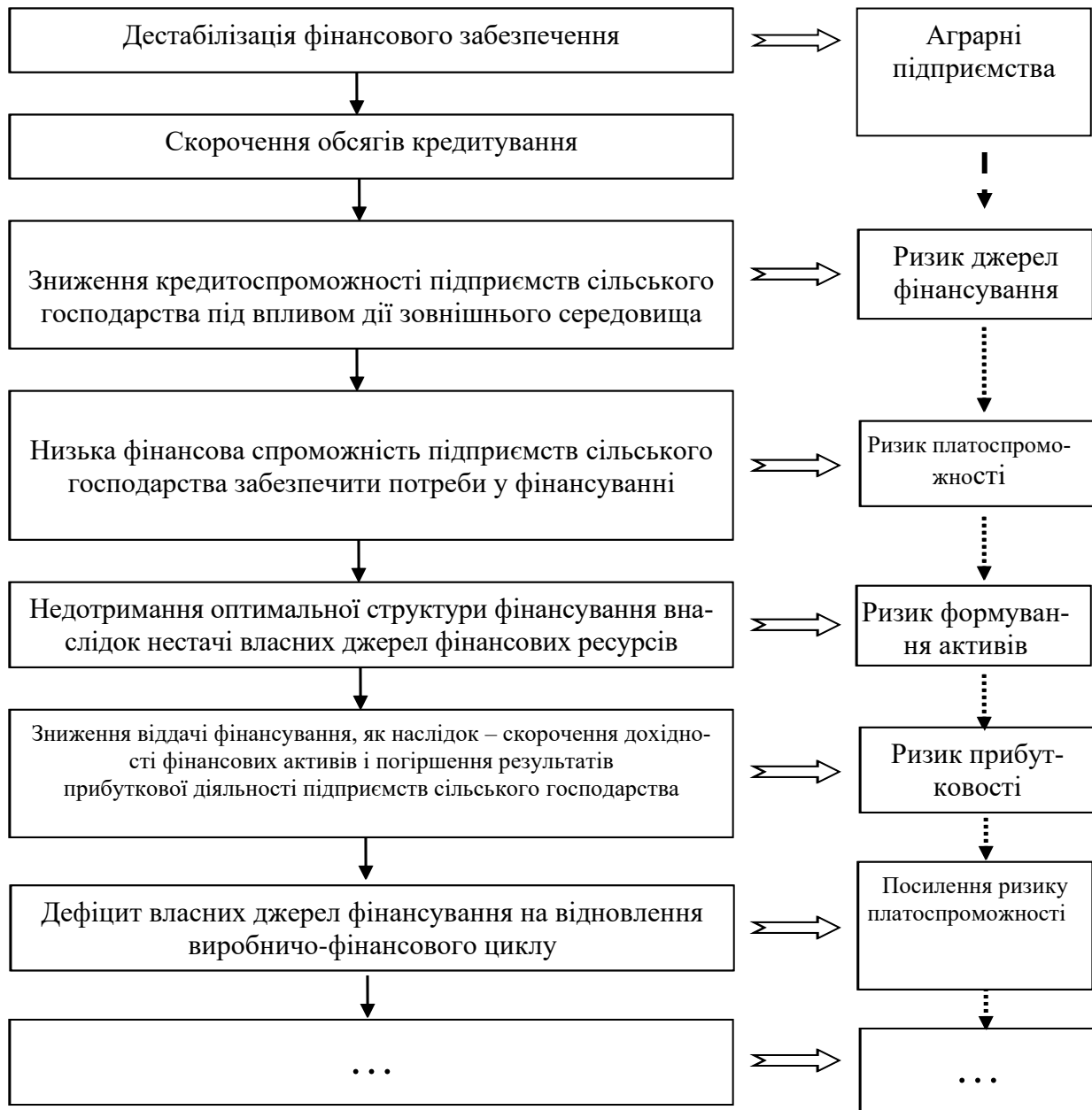
Рис. 1. Прояви впливу дестабілізації фінансового забезпечення на потенціал фінансової безпеки аграрних підприємств