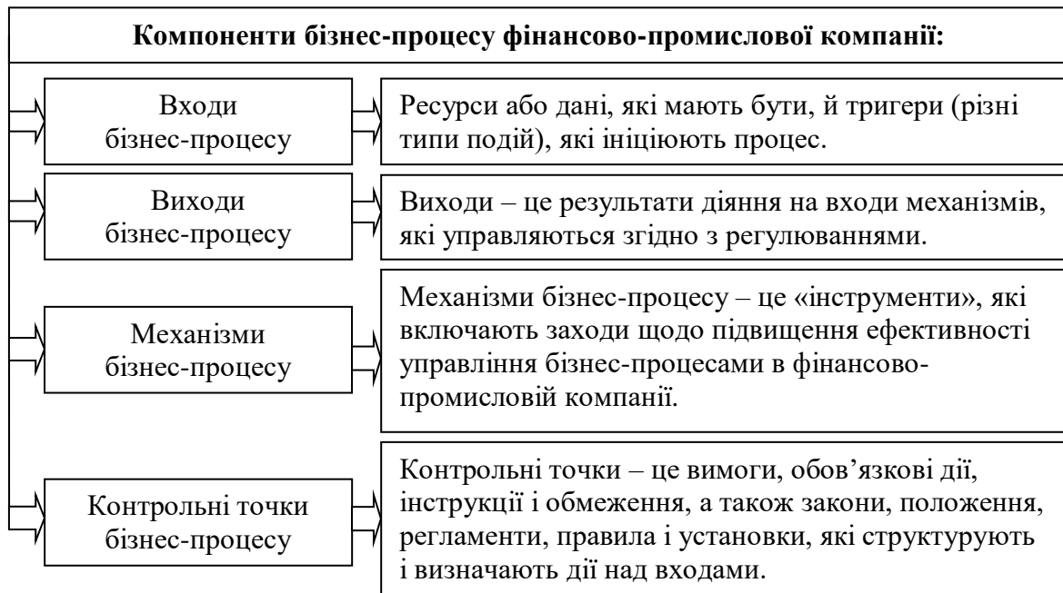
Рис. 1. Компоненти бізнес-процесу фінансово-промислової компанії