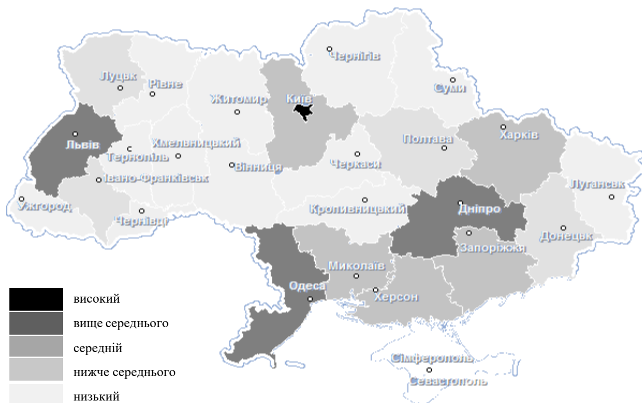
Рис.1. Карта регіонального рівня розвитку туристичної інфраструктури в 2015-2020 роках

Оцінити рівень розвитку туристичної інфраструктури регіонів України пропонуємо за одним з підходів до виміру інтегральних індексів п'ятнадцяти показників внутрішнього туризму, що відображають стан структурних елементів цільових факторів дослідження [11, с. 131]. Використана методика дала можливість згрупувати території за рівнем розвитку в них інфраструктури (рис. 1). Межі інтервалів груп базувалися на засадах середнього значення інтегральних індексів, що відповідає загальним правилам статистики.