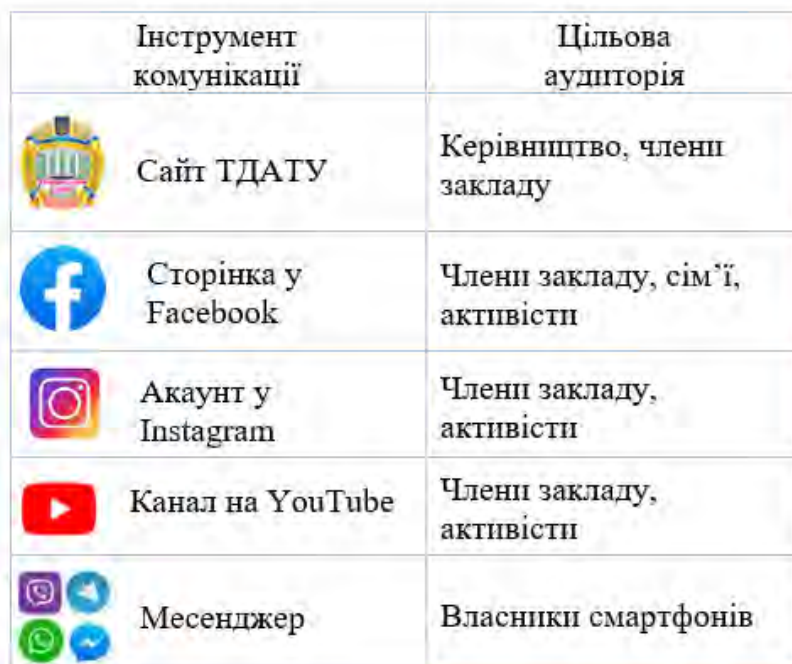
Рис. 1. Інструменти комунікації

Сьогодні існують тисячі вебсайтів, десятки соціальних мереж і месенджерів. Як серед такого вибору знайти оптимальний варіант використання комунікації в закладі? Відповідь доволі проста: потрібно чітко визначити свою цільову аудиторію та найефективніші канали комунікації з нею. У схемі нижче наведені дані про те, які інструменти найкраще підходять для різних цільових аудиторій (рис. 1).