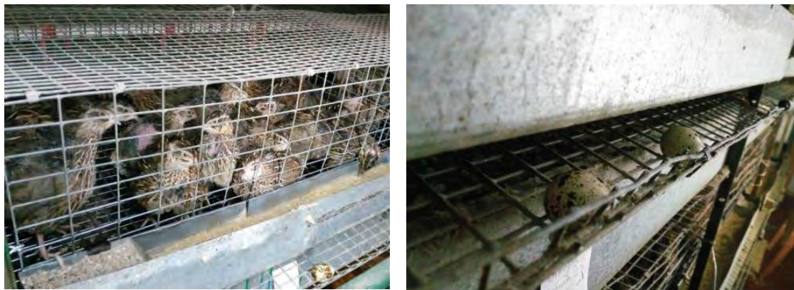
Fig. 2. General view of the foot grate with optimal cell size and shock-absorbing properties

the front side of the cage. Insufficient inclination of the foot grate leads to retention of eggs on it, which increases their contamination and the likelihood of breaking. When the foot grate is tilted by 5^\circ , the number of eggs that did not roll out of the cage is 2,8 %, and at 8^\circ it decreases to 1,9 %. The slope of 8-10^\circ is considered optimal [5]. At the same time, the foot grate should be monitored from time to time for the presence of deflections, because the retention of eggs under the paws of a bird with sharp claws exposes them to additional notches, bruises and pecks. Such deflections are not eliminated by laying angle steel slats under the lattice, since in this case the rigidity and mass of such a lattice increases sharply with the broken of eggs, especially over the slats. If the quails are planted too tightly, the foot grate is strongly strained, which increases its rigidity and leads to an increase in the breaking.