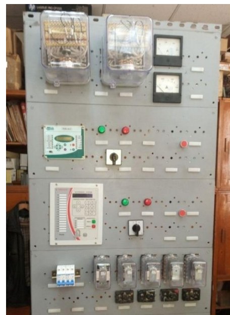
б – нова панель захисту силового трансформатора на основі мікропроцесорних пристроїв