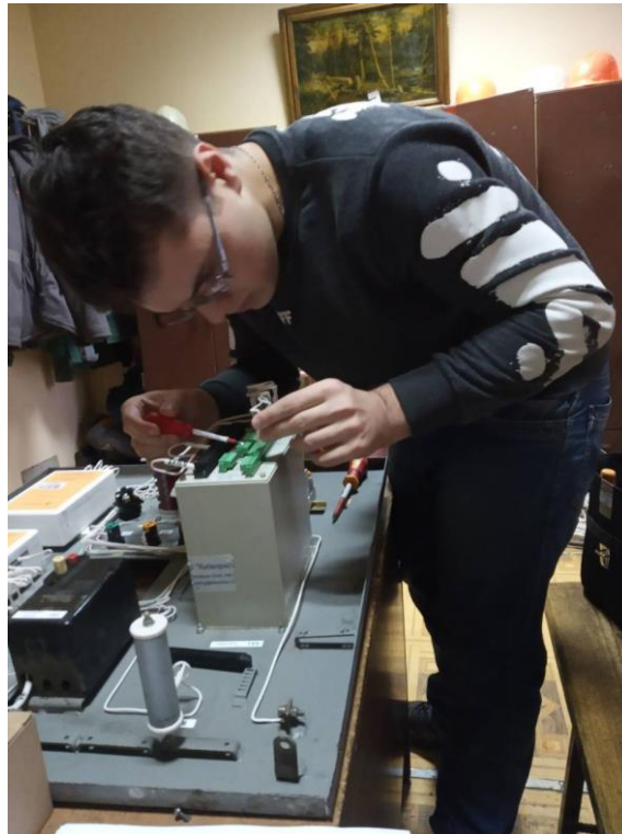
Рисунок 1. Монтаж та наладка новітнього обладнання