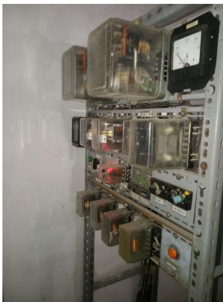
а – стара панель захисту силового трансформатора на базі електромеханічних реле