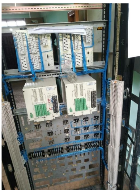
Рис. 4. Панель захисту силового трансформатора для підстанції 110/35/10 на основі SIEMENS SIPROTEC та РЕЛСІС