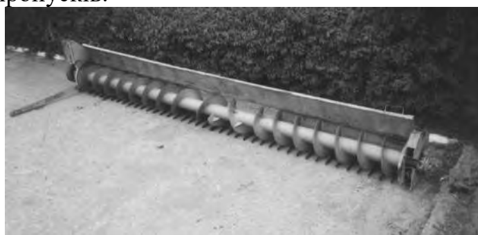
Рисунок 6. Шнековий ріжучий пристрій

Різальний апарат працює наступним чином. Рослини зрізаються сегментними ножами 3 у взаємодії з протирізальними пальцями 4. В мить зрізу граблина 2 взаємодіє боковою поверхнею з рослинами та переорієнтує їх таким чином, що вони опиняються на верхній поверхні граблини 2. Зрізана маса переміщується на граблях 2 над зоною різання до місця формування валка, тим самим зона різання постійно очищується від зрізаних стеблин. Очищення граблів 2 та утворення валка здійснюється за рахунок різкого збільшення лінійної швидкості в момент розвороту граблів. В цей час зрізані стебла взаємодіють з поверхнею відбиваючих вальців 6 активного валкоутворювача та змінюють напрям руху в потрібну область простору – зону викидного вікна. Тим самим поліпшується пропуск зрізаної маси, повністю очищується зона різання у районі вихідного вікна та утворюється валок. Рослини, що підходять до різального пристрою по центру, підводяться дільником 5 до різального апарату, що дозволяє зрізати усі рослини без пропусків.