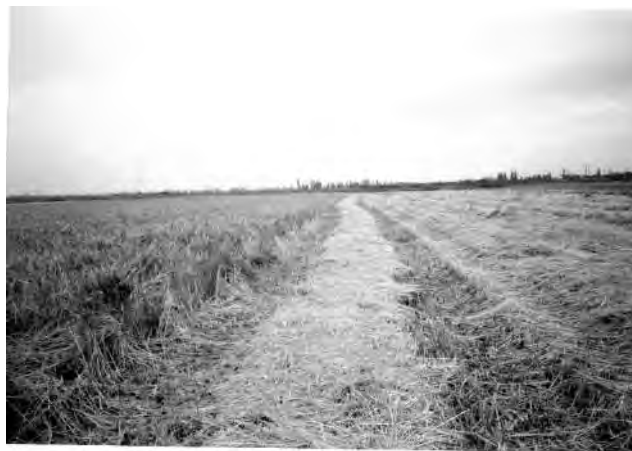
Рисунок 3. Зрізані та покладені у валок обчесані стебла

Обмолочені стебла зрізаються різальним апаратом, відводяться валкоутворюючим механізмом від рушіїв комбайна і укладаються у валок (рис. 3). Дрібно-соломистий оберемок може укладатися зверху валка, а також збиратися в змінний візок і транспортуватися до місць зберігання.