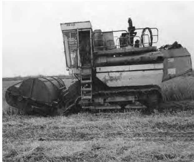
Рисунок 2. Зернозбиральний комбайн обчісувального типу з різальним пристроєм

Обмолочені стебла зрізаються різальним апаратом, відводяться валкоутворюючим механізмом від рушіїв комбайна і укладаються у валок (рис. 3). Дрібно-соломистий оберемок може укладатися зверху валка, а також збиратися в змінний візок і транспортуватися до місць зберігання.