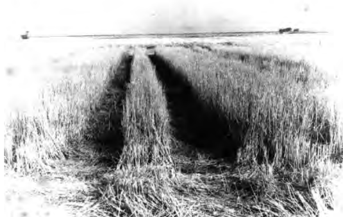
Рисунок 1. Обчесані незрізані стебла після проходження обчісувального пристрою

стебел після проходження комбайна можливі валковими жниварками з подальшим прибиранням валків соломи. Схеми із застосуванням косарок-подрібнювачів або валкових жниварок після проходження комбайна з обчісуючим пристроєм не забезпечують повний збір усієї маси через утворення колії від ходової частини комбайна. Особливо багато соломи губиться при збиранні зернових культур на перезволожених ділянках та збиранні рису. Втиснутими в колію залишається понад 30% незрізаних обчесаних стебел (рис. 1), що негативно позначається на післязбиральному обробітку ґрунту.