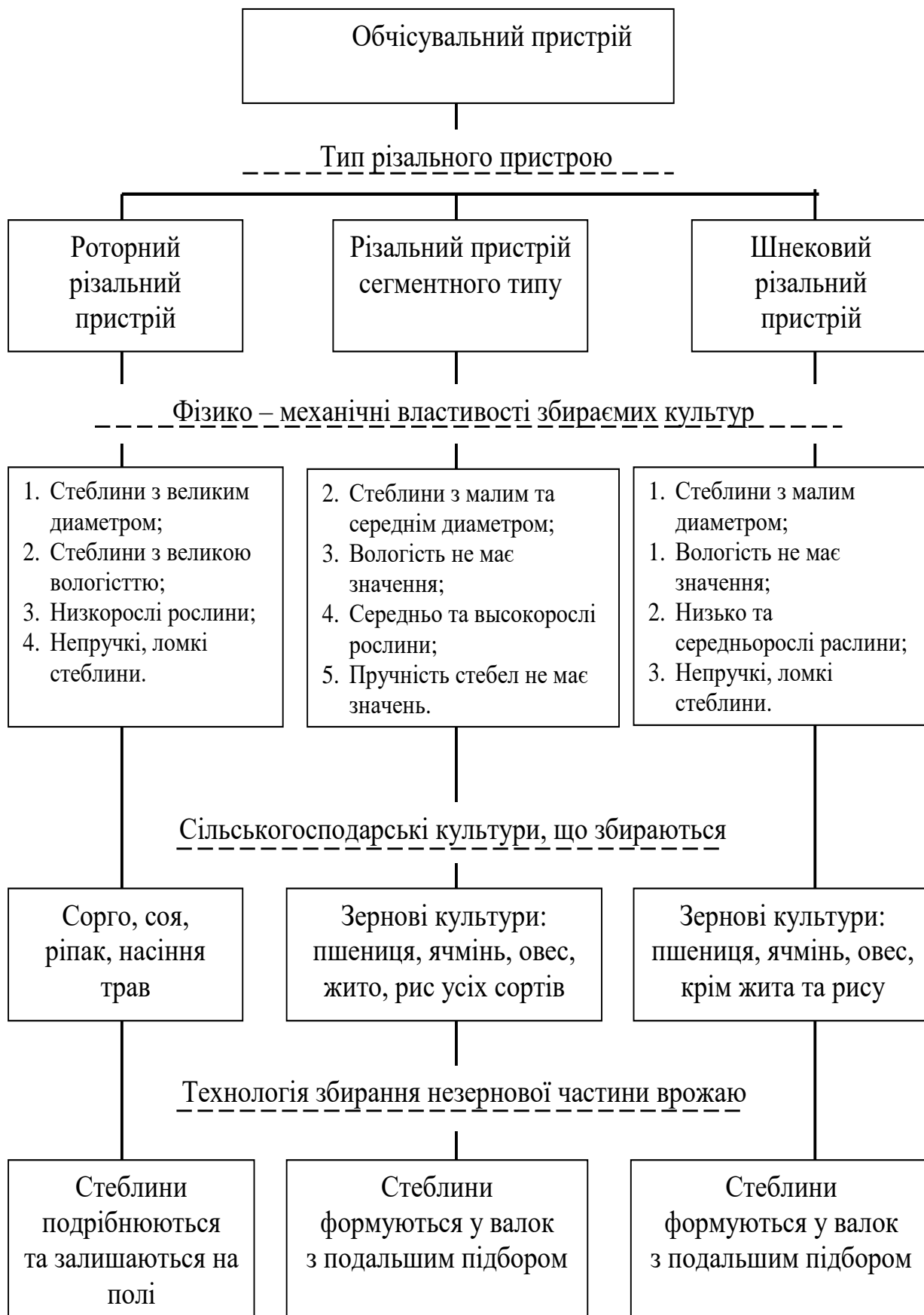
Рисунок 7. Схема вибору різального пристрою