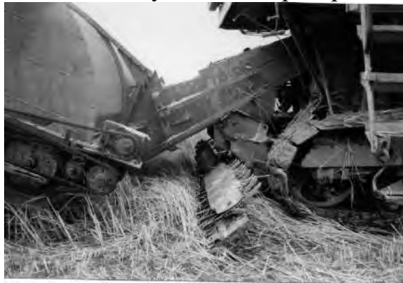
Рисунок 4. Ріжучий пристрій сегментного типу з транспортуючим механізмом

Залежно від обраного технологічного процесу збирання незернової частини врожаю, а також від фізико-механічних властивостей культур, що убираються, у Таврійському агротехнологічному університеті розроблено кілька видів ріжучих пристроїв (роторний, сегментний з транспортуючим механізмом – рис. 4 та 5, шнековий, розробки доцента кафедри машиновикористання в землеробстві Аюбова А.М. – рис. 6), які встановлюються під похилою камерою комбайна після обчісувального пристрою.