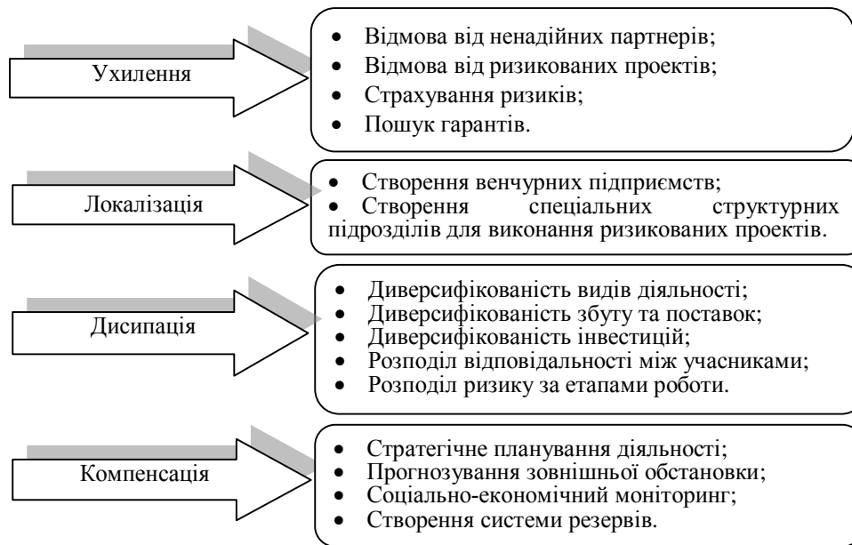
Рис. 3. Методи управління ризиком