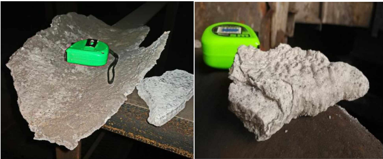
Мал.2. Відкладення після механічного очищення труби підводу охолоджуючої води

Температура води у контурі коливається у межах 50-60 0 С, що, у присутності великої кількості зважених часток - карбонатів кальцію та магнію, а також сполучень сірки, призводить до головної проблеми – активного формування складних, термоізолюючих, дуже твердих відкладень, які, поступово, блокують перетини труб, погіршуючи ефективність роботи вузлу мокрого газочищення аж до повної зупинки та виводу всієї системи у ремонт.