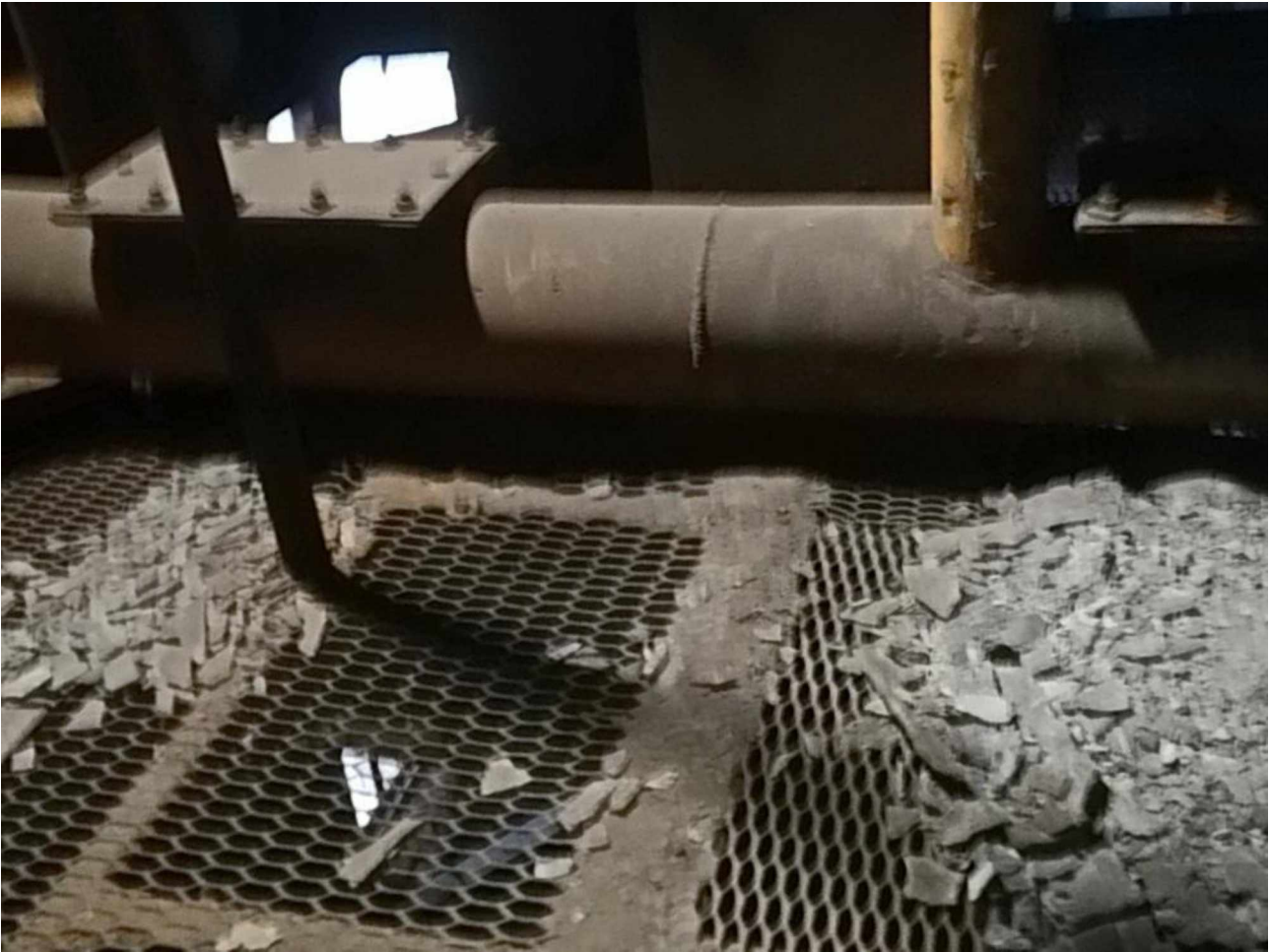
Мал.3. Відкладення після механічного очищення елементів апаратів Вентурі

Таким чином, внаслідок швидкого заростання елементів контуру водоохолодження системи мокрого газоочищення газів, що відводяться, товстим та міцним товстим шаром відкладень на сульфатно-карбонатній основі, відбувається погіршення термо- та гідродинамічних показників всієї системи аж до повного блокування, додаткові витрати на ремонти та запчастини та інше.