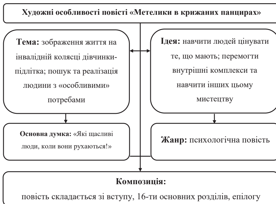
Рис. 2. Художні особливості повісті «Метелики в крижаних панцирах»