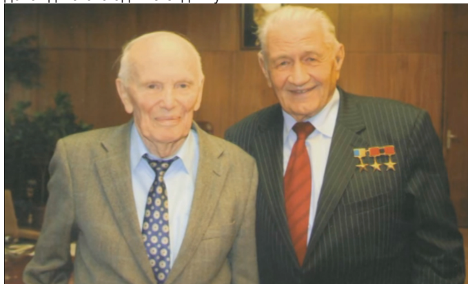
Академік академії НАН України Б.С.ПАТОН і Д.К. МОТОРНИЙ

Почесна відзнака «За багаторічну плідну працю в галузі культури» (2003).