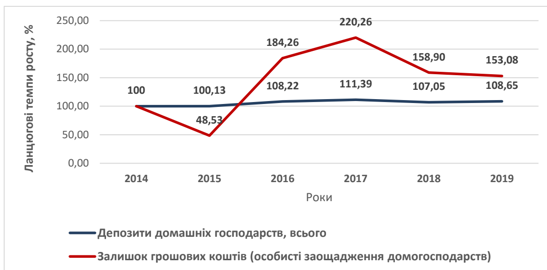
Рис. 1. Динаміка ланцюгових темпів росту розмірів депозитів домашніх господарств та залишку грошових коштів, %