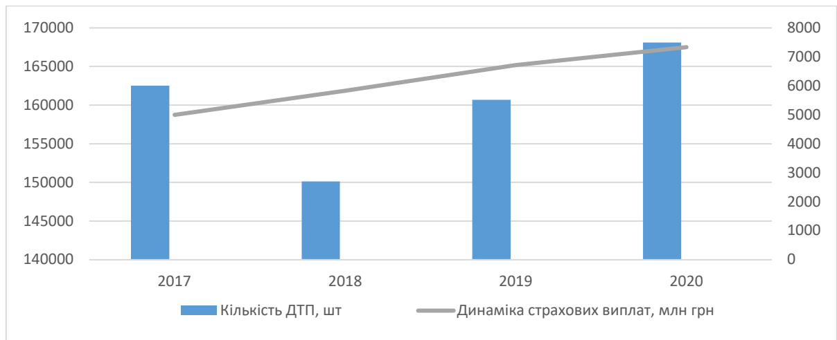
Рис. 1. Динаміка кількості ДТП та страхових виплат за договорами автострахування за 2017-2020 рр. [3], [4]

Аналіз рис. 1 показав, що сума страхових виплат та кількість ДТП з кожним роком збільшується. Найбільша кількість ДТП була у 2020 році – 168107 од. А отже, власники транспортних засобів потребують оцінки завданих збитків. Вони звертаються до оцінювачів, а вони, в свою чергу, проводять оцінку збитків завданого власнику ТЗ. На основі цих висновків страхові компанії здійснюють виплати страхових відшкодувань.