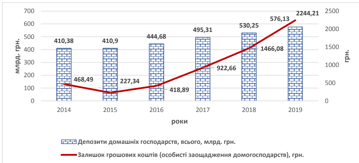
Рис. 3. Динаміка депозитів домогосподарств України (млрд. грн.), а також особистих заощаджень в середньому на 1 домогосподарство на місяць, грн.

За 2014-2019 роки розмір витрат на купівлю нерухомості збільшився більше, ніж в 34 рази. З одного боку, це свідчить про бажання населення зберегти кошти від девальвації, особливо після кризового 2014 року, з іншого – про недостатній рівень довіри до фінансових установ [2]. На рис. 3 наведені дані про порівняння динаміки депозитів домашніх господарств з динамікою розмірів особистих заощаджень.