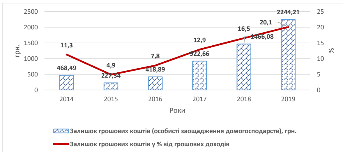
Рис. 1. Динаміка особистих заощаджень домогосподарств України, грн. в середньому на 1 домогосподарство на місяць

Доходи від підприємницької діяльності в 2019 році становили 7,1%, доходи від власності (дивіденди від акцій та інших цінних паперів, відсотки по вкладах, доходи від здачі внайми нерухомості тощо) – лише 1,1% від загальної суми грошових доходів домогосподарств. За 2014-2019 роки залишок грошових коштів (особисті заощадження домогосподарств) зростає щорічно в середньому на 36,8% і становив у 2019 році 2244,21 грн., або 20,1% від середньомісячних грошових доходів одного домогосподарства.