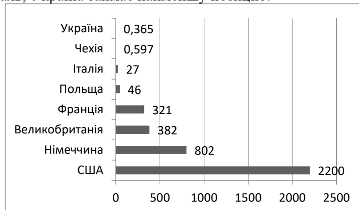
Рис. 1. Фінансова підтримка з боку держави економічній діяльності під час пандемії у 2020 році , млрд долл [3]

Статистика міжнародного досвіду свідчить про значну підтримку бізнесу з боку держави (рис. 1). На жаль, Україна займає найменшу позицію.