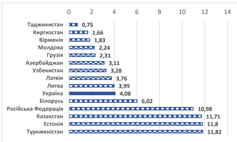
Рис. 2. Загальні викиди CO 2 на душу населення у 2018 році, т CO 2