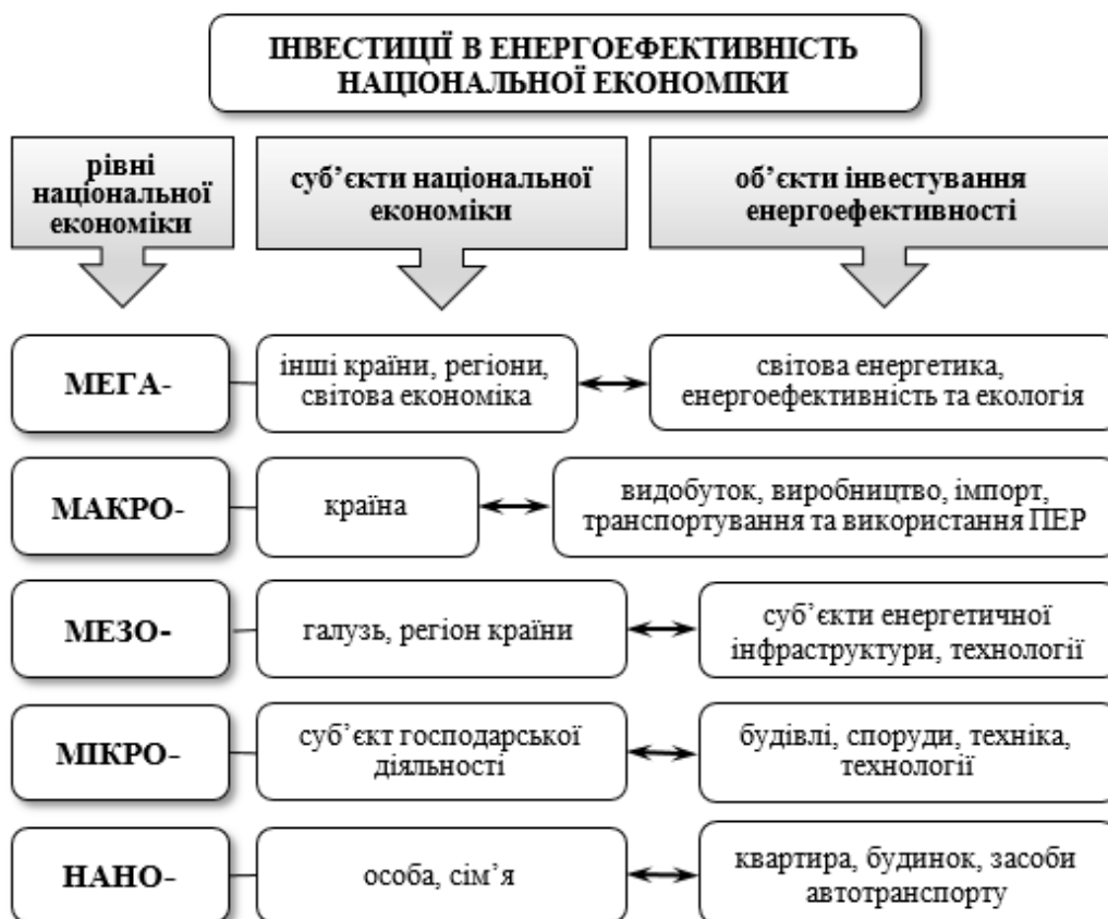
Рисунок 2. Ієрархічна система інвестування в енергоефективність національної економіки

Інвестиції в енергоефективність – це складна, динамічна, ієрархічна система, яку доцільно розглядати за наступними рівнями (рис. 2).