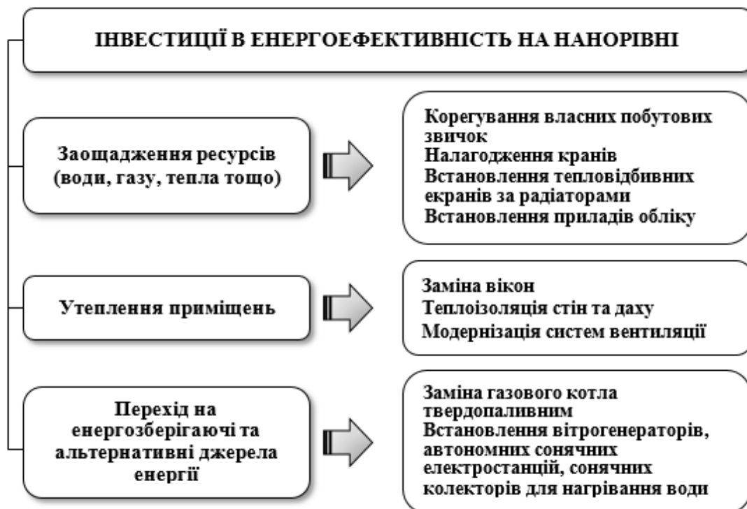
Рисунок 5. Напрями інвестування в енергоефективність на нанорівні

В Україні існує державна підтримка енергозбереження, яку можна вважати державними інвестиціями в енергоефективність на нанорівні. Так, з 2014-го року для населення та ОСББ діє Урядова програма