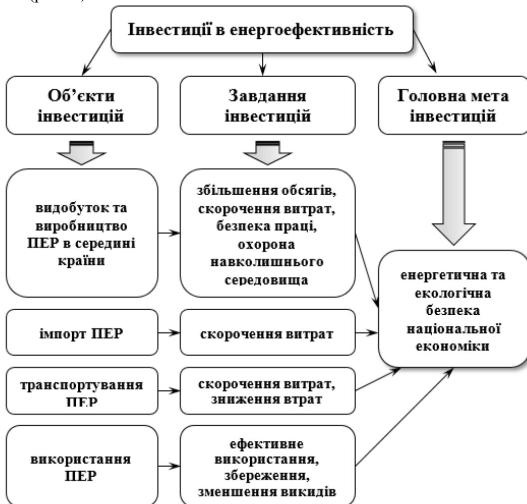
Рисунок 1. Інвестиції в енергоефективність як система об'єктів, завдань та головної мети

Основна частина. Системний аналіз є науковим методом пізнання, що являє собою послідовність дій зі встановлення структурних зв'язків між елементами системи, яка досліджується. Саме тому інвестиції в енергоефективність необхідно розглянути як систему взаємопов'язаних елементів – наприклад, об'єктів, завдань та головної мети (рис. 1).