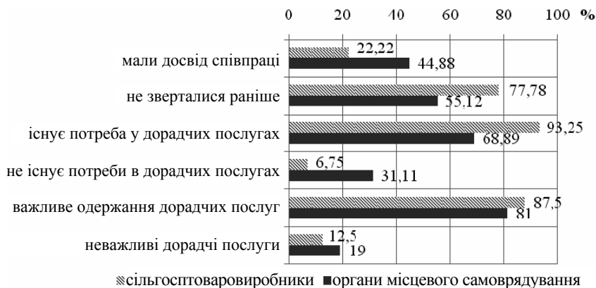
Рис. 1. Визначення досвіду та потреби в зверненні до дорадчих служб

У результаті вибіркового анкетного опитування суб'єктів дорадчої (інформаційно-консультаційної) діяльності: сільськогосподарських товаровиробників, представників органів місцевого самоврядування (голів сільських та селищних рад), сільських мешканців та представників дорадчих служб Запорізької області з'ясовано, що більше 20% сільськогосподарських виробників та 45% голів сільських та селищних рад – потенційних клієнтів, охоплені інформаційно-консультаційною діяльністю. Важливим для себе одержання дорадчих послуг вважають 87,5% підприємців та 81% сільських мешканців (рис. 1).