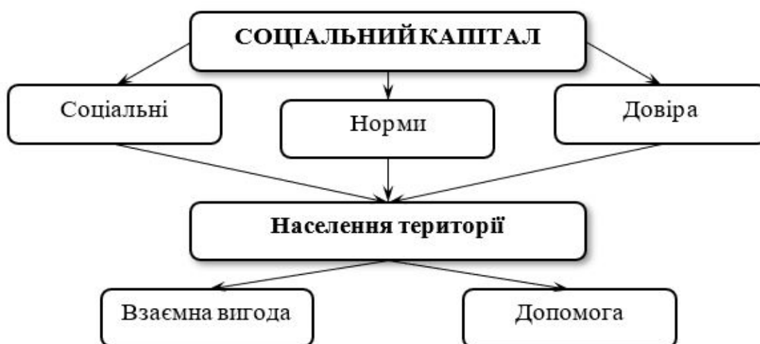
Рис. 1. – Сутність соціального капіталу території

Для визначення місця соціального капіталу в розвитку території використано метод аналізу ієрархій. На рис. 2 побудовано відповідну 3-рівневу ієрархічну модель. На 1-му рівні розташована інтегральна оцінка «Розвиток території»), на 2-му – його укрупнені характеристики («Економіка», «Суспільство», «Якість життя»), на 3-му – їхні часткові характеристики.