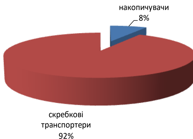
Рис. 3. Співвідношення відмов за елементами системи гноєвидалення

В основному в системі гноєвидалення виходять із ладу підшипники, зірочки, скребки, ланцюги, редуктора, електродвигуни. Ці вузли