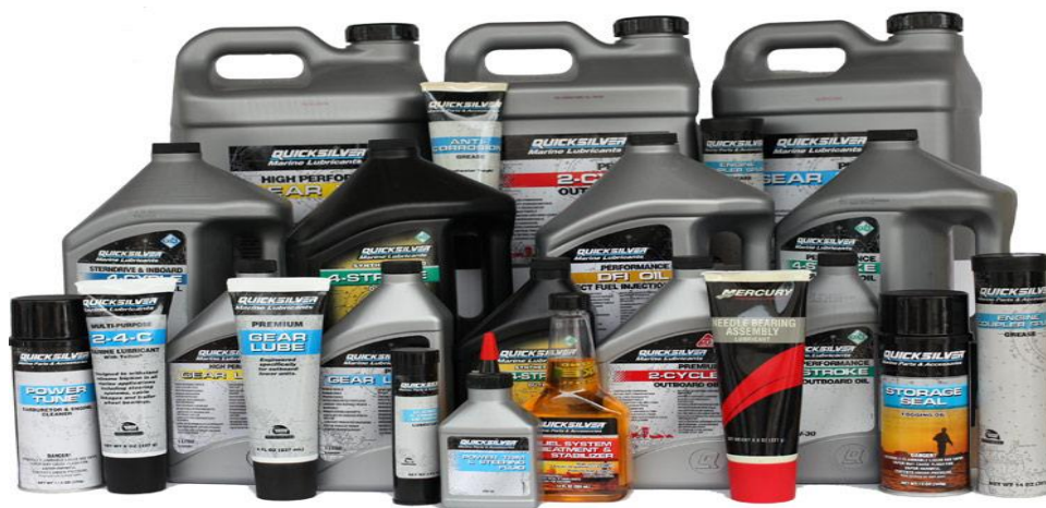
Рис. 1. Сучасні моторні і трансмісійні оливи

В основному сучасні добавки призначені для роботи з моторними і трансмісійними оливами (рис.1).