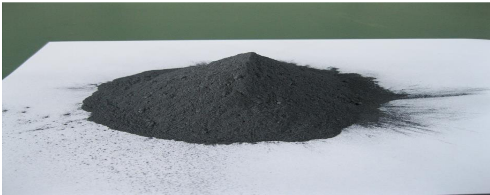
Рис. 3. Антифрикційна добавка на основі молібдену

Утворена молібденовмісна плівка володіє дуже високими антифрикційними властивостями. На практиці застосовують два способи отримання плівки: створення штучних сполук молібдену, які повністю розчиняються в моторній оливі (таким чином виготовляють препарати «Економін», «Фріктол», «Моліпріз») та застосування природного з'єднання дисульфиду молібдену (лідером у використанні дисульфиду молібдену є компанія Дау-Кронінг, продукцією цієї компанії користуються провідні фірми - виробники олив і мастил, найбільш відомі її добавки M-55 і Molykote) (рис.3).