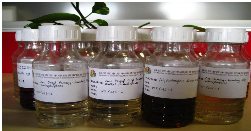
Рис. 2. Сучасні добавки і присадки до змащувальних матеріалів

Тверді нерозчинні речовини, як правило, неорганічного походження називають антифрикційними добавками. Але цим же терміном «добавка» називають, наприклад, компоненти, що вносяться до оливи для поліпшення їх миючих властивостей, які добре розчиняються в них, і їх називають миючі добавки (а не присадки) [9]. Тому під загальним терміном «добавка» розуміється сполука або комплекс сполук, що вносяться до оливи на стадії їх експлуатації (рис.2).