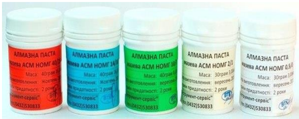
Рис. 4. Препарати на основі алмазного пилу

що сприяють абразивному зносу, або втрачають свої властивості, або розкладаються на речовини, що негативно впливають на властивості змащувальних матеріалів. З препаратів даного типу найбільш відома добавка «Деста» (рис.4).