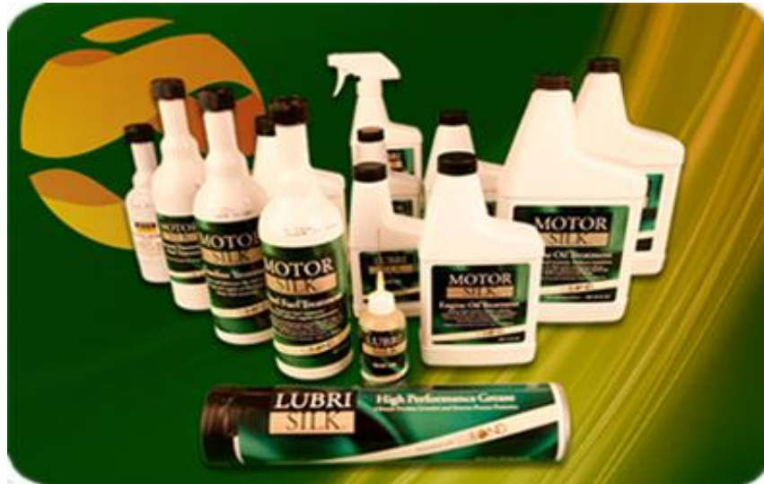
Рис. 5. Протизносні та протизадирні добавки

Однак, для введення до товарної оливи добавок і присадок необхідне дороге спеціальне обладнання. Окрім цього не всі присадки сумісні між собою, що може призвести в одному випадку до ефекту – синергізму, а іншому до ефекту – антагонізму. Виходячи із літературних джерел, відомо, що мінеральні і біологічні оливи добре змішуються. Тому необхідно провести триботехнічні дослідження по встановленні відсоткового співвідношення біологічної і мінеральної оливи та визначити оптимальний склад багатофункціональної присадки, яка відповідала умовам роботи гідросистем.