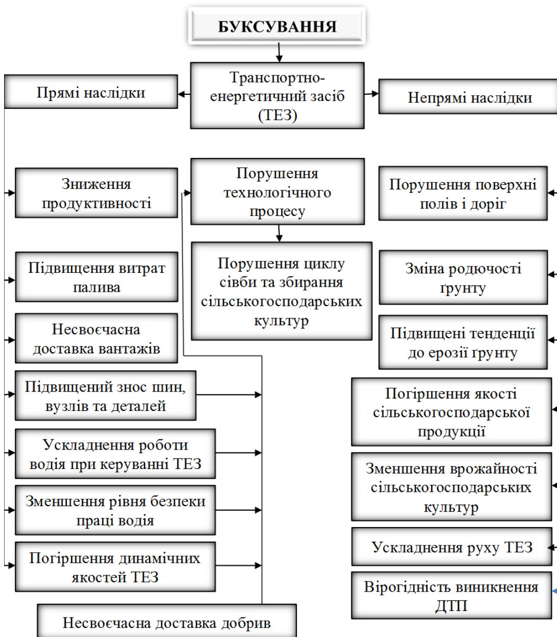
Рис. 1. Прямі та непрямі наслідки буксування

Буксування – одне з негативних явищ при взаємодії шини з поверхнею кочення (рис. 1). Вона зумовлена величинами коефіцієнтів зчеплення і опору коченню. Для роботи ТЕЗ в умовах бездоріжжя і тимчасового погіршення ґрунтових умов необхідно зберегти показники прохідності і тягово-зчіпних властивостей, отримані в звичайних умовах [10,11].