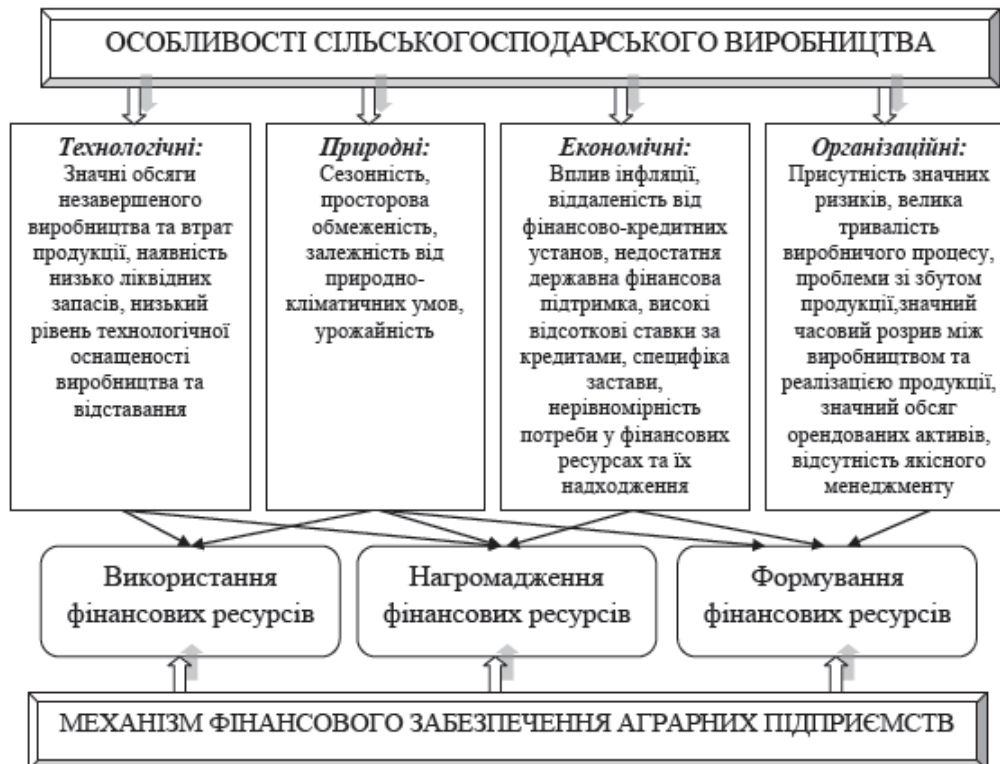
Рис. 2. Особливості сільськогосподарського виробництва на фінансове забезпечення аграрних підприємств [5]

При цьому оптимальний варіант фінансової політики аграрних підприємств полягає у розробці напрямів залучення та використання фінансових ресурсів на перспективу з метою досягнення стратегічних й тактичних цілей підприємства, за якого: доходи мають формуватися та використовуватися відповідно до масштабів виробництва і реально поставлених завдань, з урахуванням залежності фінансових надхо-