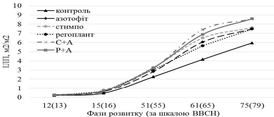
Рис. 2. Зміни індексу листкової поверхні посівів гороху за окремої та сумісної дії біостимуляторів (Стимпо, Регоплант) та мікробіологічного препарату Азотофіт протягом вегетації.

Дія біостимуляторів та мікробіологічного препарату на вміст хлорофілу в прилистках горо-