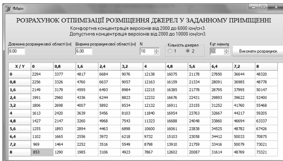
Рис. 2. Результати роботи виконавчої програми для двох джерел