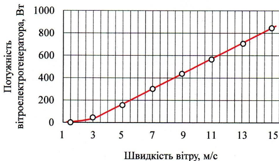
Рис. 3. Залежність потужності ВЕГ від швидкості вітру при струмі навантаження 25 А

Висновки. На основі аналізу існуючих малопотужних ВЕГ і виявлених конструктивних недоліків розроблено малопотужний ВЕГ