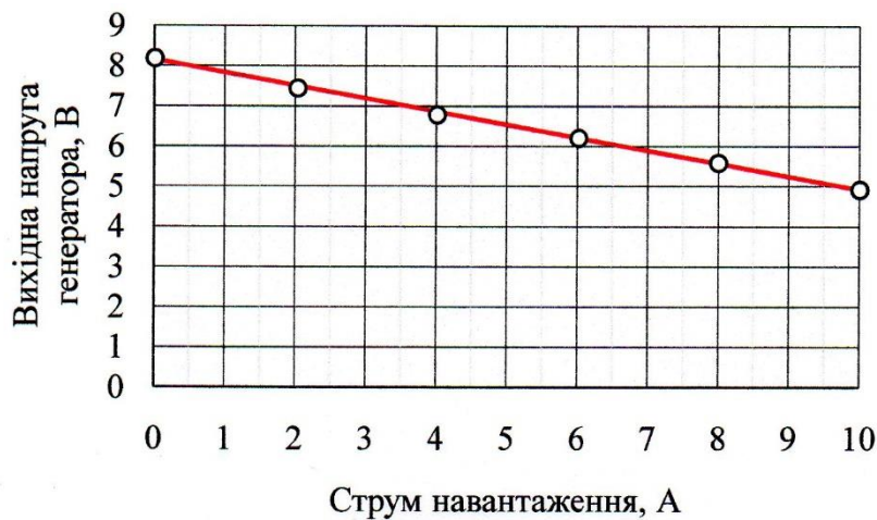
Рис. 2. Зовнішня характеристика ВЕГ