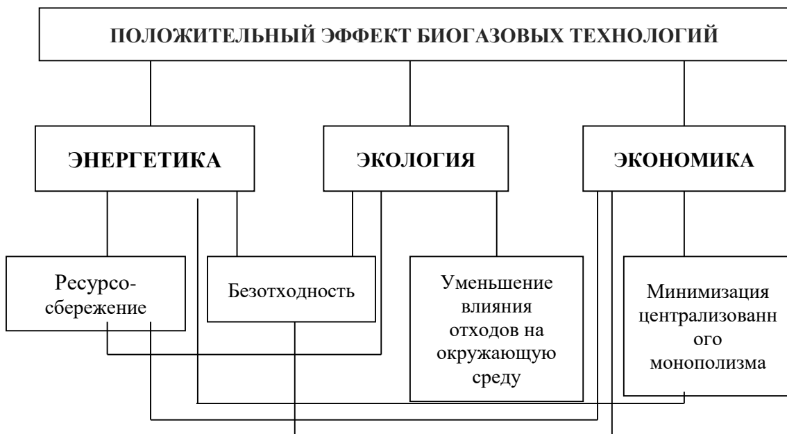
Рис. 1. Составляющие интегрального положительного эффекта биогазовых технологий

По сравнению с традиционными видами топлив и другими альтернативными источниками энергии биогаз сжигается в теоретическом количестве воздуха, благодаря чему обеспечивается высокий тепловой КПД и большая температура горения, биогаз загорается при любых температурах окружающей среды и обладает высокими противодетонационными свойствами (рис. 1).