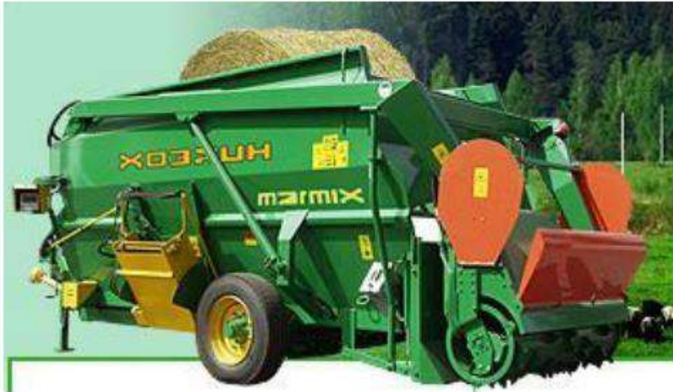
Рис. 1. ИСРК-12Ф «Господар»

Економічно виправданим і енергозберігаючим є закладання на зберігання подрібнені до необхідних розмірів корму. Найбільш енергозберігаючим для виїмки сінажу та силосу з траншей є використання універсальних машин (ИСРК-12Ф «Господар» (рис.1); ПЕ-0,8Б; ПУ-0,5; НГС1,0 «Карпатец-1000С»; ПГБ-1,0 «Карпатец-1020М»; НГП-0,5; НН -0,25; ПС-0,5 / 0,8Б).