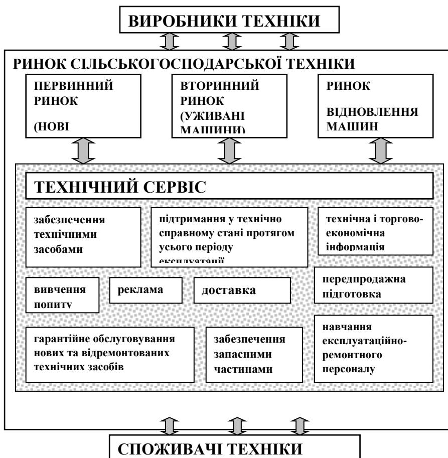
Рис. 1. Складові ринку сільськогосподарської техніки

Однією з провідних галузей національної економіки є сільське господарство, подолання кризових явищ у якому, розвиток ринкових відносин, забезпечення продовольчої безпеки країни неможливі без відповідного розвитку матеріально-технічної бази та ефективних інвестицій у технічне оснащення аграрного виробництва [4, 5, с. 193]. Технічний потенціал АПК, від стану якого напряму залежать успіхи аграрного виробництва, потребує відповідного розвитку ринку сільськогосподарської техніки [2]. Вважаємо, що центральне місце серед його складових належить технічному сервісу [3], однією з головних функцій якого є забезпечення споживачів техніки (аграріїв) технічними засобами (рис. 1) [7].