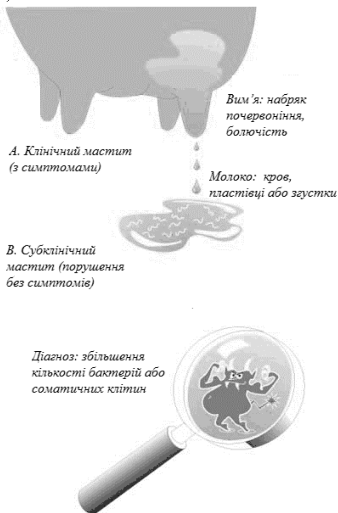
Рис. 1. Діагностика мастита: А – клінічний, В – субклінічний

Мастит виникає у корів різної продуктивності і завдає значних економічних збитків виробникам молока за рахунок його недоотримання і зниження якості, передчасного вибракування корів, захворюваності новонароджених телят, значних витрат на лікування та ставить цю проблему в ряд найважливіших завдань сучасної науки. Мастит – це запалення молочної залози, яке може бути викликане бактерійною інфекцією або травмою. На 100 корів зазвичай доводиться 20...100 клінічних випадків мастита в рік. Мають місце і субклінічні випадки, коли близько 5...35% чвертей вимені інфіковано патогенними бактеріями. Клінічний мастит буває достатньо легко виявити (рис. 1).